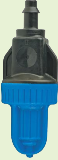
Super Fogger x 2